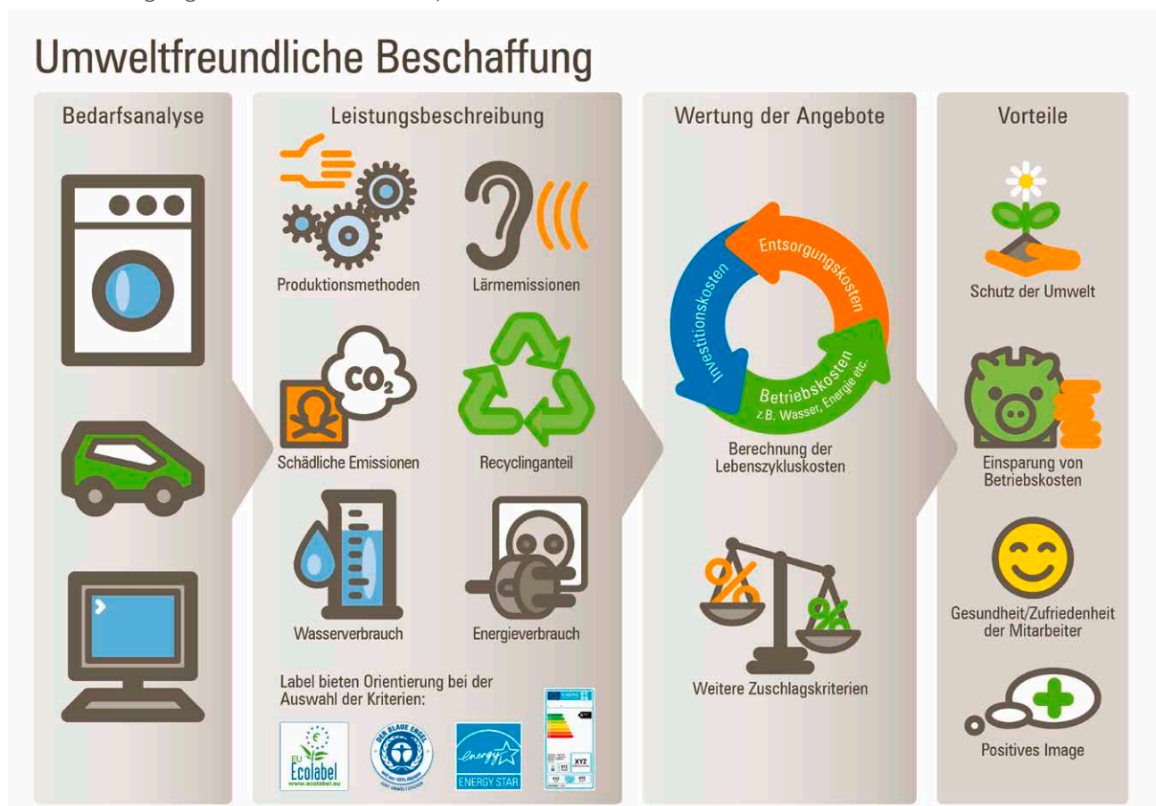
Abbildung 1: Schematischer Überblick über Umweltaspekte im Vergabeverfahren, Berliner NetzwerkE ( www.berliner-netzwerk-e.de )

Die folgende Abbildung zeigt eine Übersicht über die verschiedenen Schritte des Vergabeverfahrens und die Einbeziehung von Umweltkriterien. Nicht enthalten sind hier diesbezügliche Anforderungen an die Eignung und die Auftragsausführung.